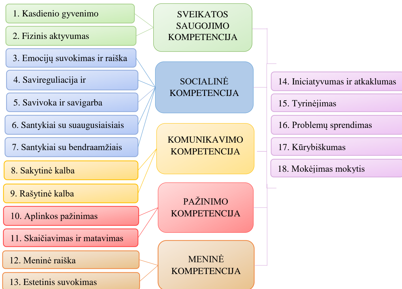
2 pav. Ugdymo modelis vaiko pasiekimus jungiant pagal kompetencijas.