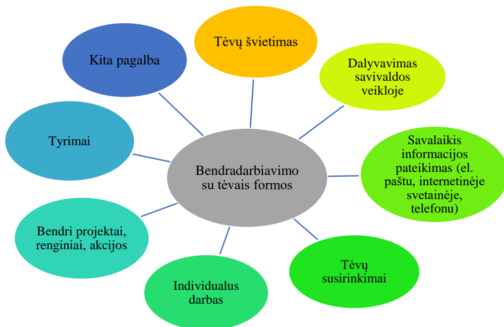
1 pav. Įstaigoje puoselėjamos bendradarbiavimo su tėvais formos.

Tėvų pageidavimu, įstaigoje organizuojamas papildomas ugdymas.